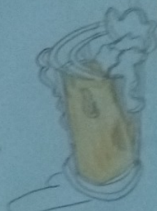
1 verre de bière (15cl) - 5°