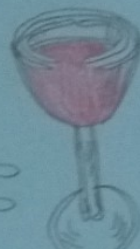
1 verre de vin (10cl) - 12°