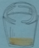
1 verre d'alcool fort (3cl) - 40°

1 verre = 1 dose = 10g d'alcool dans la serving quelle que soit la boisson alcoolisée, un verre représente la même quantité d'alcool soit 10g d'alcool pur!