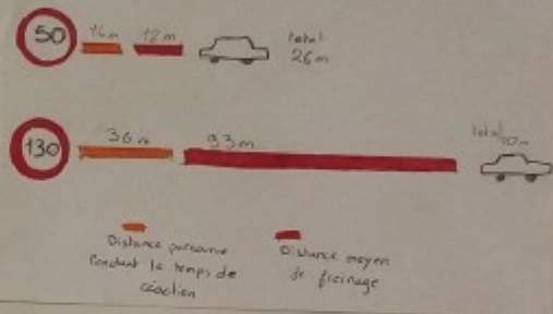
Distance d'arrêt en fonction de la vitesse