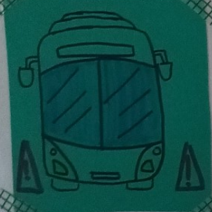
Visibilité de loin

Les angles morts sont des endroits qui ne sont pas dans le champs de vision du chauffeur. Ils sont donc dangereux pour ceux qui s'y trouvent.