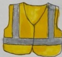
le gilet jaune